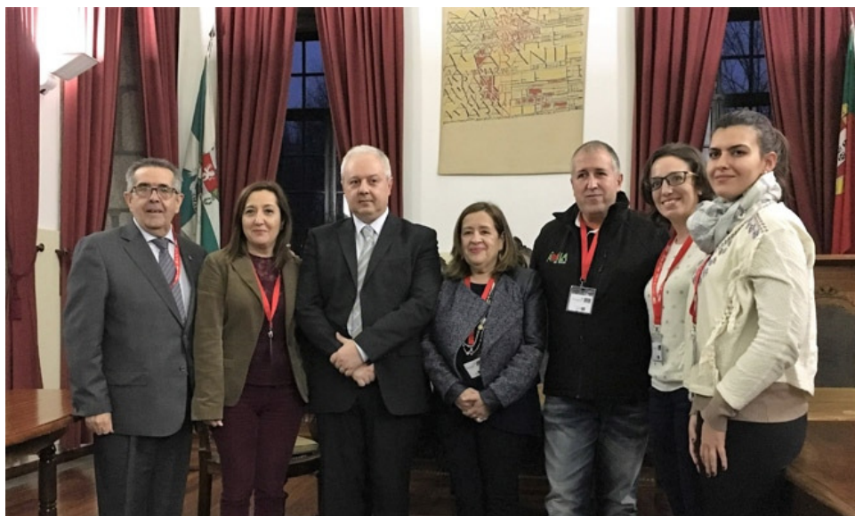
Encuentro sobre enoturismo en Amarante (Portugal).

La Diputación ha participado en Amarante (Portugal) en un encuentro sobre enoturismo al que ha sido invitada por la Ruta del Vino de Rueda, en el marco del proyecto europeo 'Rural Growth' y de la mano del Ayuntamiento de Medina del Campo (Valladolid).